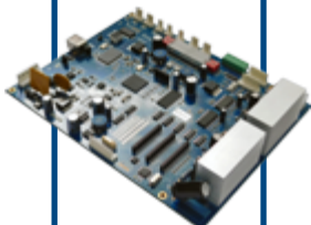
BOARD HOSON R800 - XP600