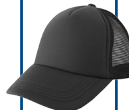
GORRA CAMIONERA BICOLOR