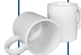
MUG 11 ONZ BLANCO