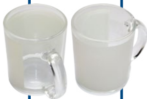
MUG 11ONZ CRISTAL